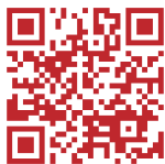
堀川ゼミ公式サイトへのQRコード