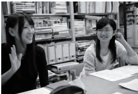
FSS File Photo, 2015.

私 は地元から県外に進学する時に感じた周囲の人から強い圧力をなぜ感じるのかを3年間のゼミ論文のテーマとして取り組みました。大学1年生の時、外から地元を見ていた私はそのことにモヤモヤを感じつつも、当時の私には、この疑問を明快に語る力量はありませんでした。しかし、2年生になりゼミに入ってから、週一回のゼミで先生や同期との議論を通して、物事を考え、深めていく上での基礎を鍛えることができました。また、本やインタビューを通して知識を得ることで、最終的に自分なりの答えを出せました。これだけ聞くと敷居が高いように思えますが、私も失敗を繰り返し、試行錯誤し、ようやく卒業論文で論文の形に出来たので、最初から何もかも出来た訳ではありません。最初はレジュメをどのように作るか、どのように本を読むかをゼミ生や先生と一緒に考えて積み上げていくので、自分の興味があることに懸命に取り組んでみたい人にはピッタリなゼミだと思います。また、合宿やバーベキューなど先輩や後輩と交流できるイベントもあるので、勉強以外にも充実しています。(14期生・宮里遼大 [在籍当時に書かれたもの])