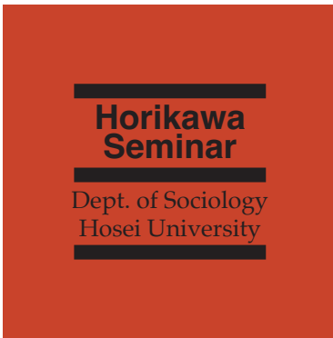
堀川ゼミの公式ロゴ（デザイン＝堀川三郎）