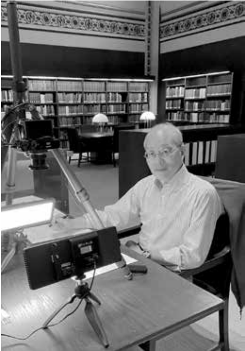
セントルイスの文書館にて史料を複写中（2023）