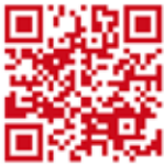
堀川ゼミ公式サイトへのQRコード